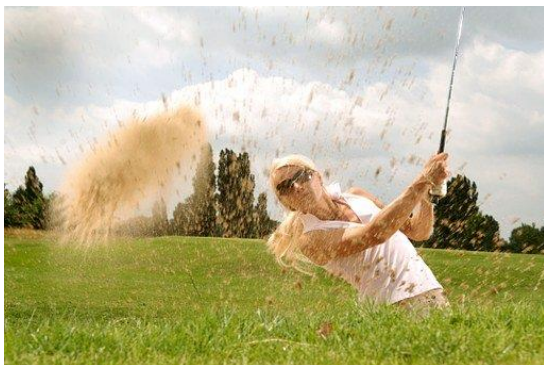
Abb. 1: Abschlag im Golf

Das Abbildungsverzeichnis kann in Microsoft Word unter Referenzen → Abbildungsverzeichnis einfügen erstellt werden