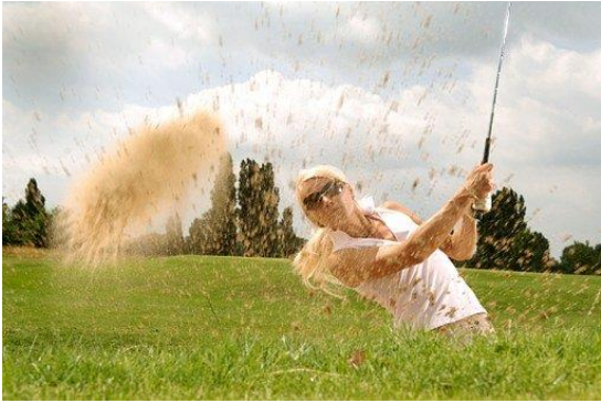
Abb. 1: Abschlag im Golf